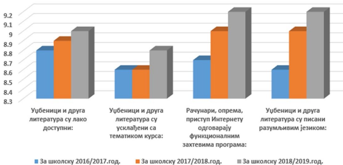
Слика 2. Упоредна анализа резултата анкете студената: оцена студената за наставно образовну литературу, приступ Интернету и рачунарску опрему у претходне три године