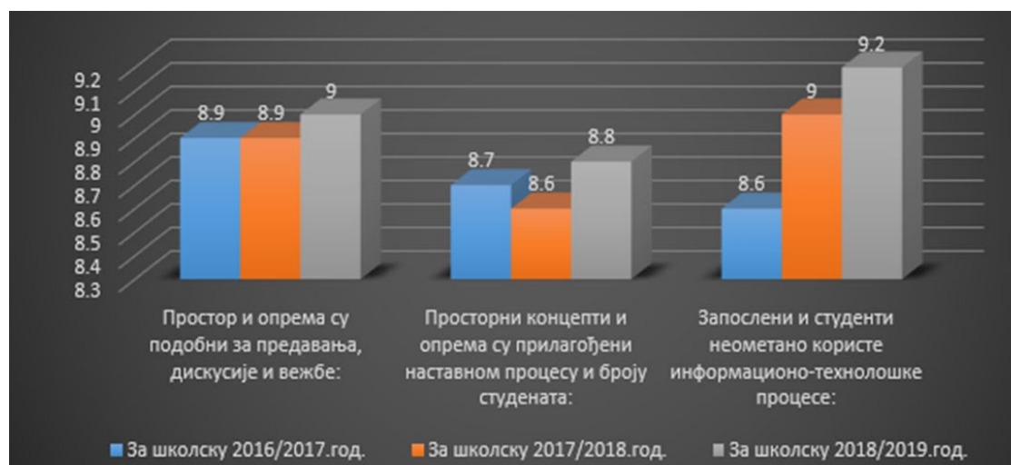
Слика 1. Упоредна анализа резултата анкете студената: оцена студената за простор, опрему и информационе технологије у претходне три године